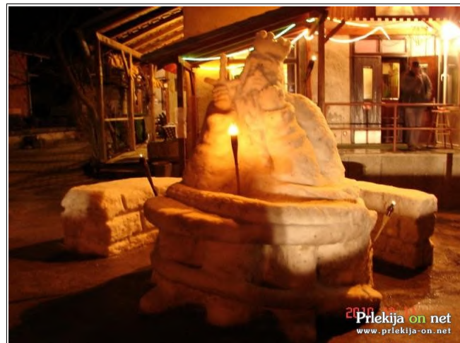
Kralj Matjaž

Člani pohodniške sekcije TD Mala Nedelja-Radoslavci tudi v teh zimskih dneh ne počivajo, ampak se pripravljajo na tekmovanje v gradnji snežnih skulptur, ki bo konec januarja prihodnje leto v Črni na Koroškem. Malonedelčani se teh tekmovanj udeležujejo že vrsto let, spočetka zaradi zabave in druženja, zadnja leta pa se nanje sistematično pripravljajo, zato rezultati niso izostali. Letos in lani so namreč osvojili najvišja mesta-prvo in drugo po ocenah strokovne komisije in po izboru obiskovalcev.