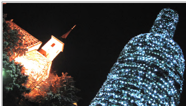
Cerkev in Smrekica steklenica