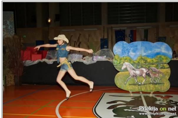
Nastop, Foto: Staš Rudolf

vsem organizatorjem za ta lep dogodek, kjer se je združilo prijetno s koristnim.