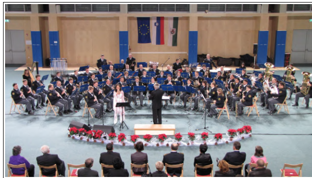
Koncert policijskega orkestra