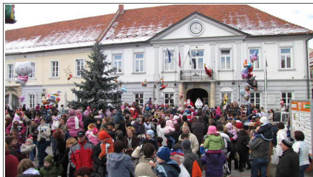
Božiček in Dedek Mraz sta obiskala Ljutomer

Na odru so se zvrstili še nastopi Mladih Prlekov in učencev glasbene šole Slavka Osterca Ljutomer, obiskovalci pa so se lahko ustavili na stojnicah Božičnega bazarja ter pokušali domače dobrote.