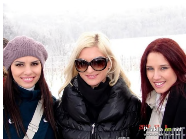
Zvezdnice na trgatvi

Družba Radgonske gorice d.d. je v soboto, 4. decembra, v Zbigovcih opravila zadnje delo v vinogradu v letu 2010. Opravili so namreč že 19. Miklavževo trgatev in drugo zvezdniško trgatev. V letu 2009 so k sodelovanju na trgatvi povabili zvezde slovenske estrade, estradniki so ponesli dober glas o tej prireditvi po Sloveniji, zato letos z udeležbo zvezd na trgatvi ni bilo nobenih težav.