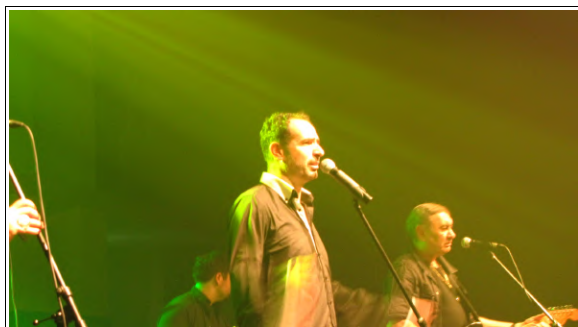
Dražen Zečić

Šic bar cafe, ki ga upravlja Vaščanka TP d.o.o., je ob prvi obletnici svojega delovanja, v športni dvorani ŠIC Ljutomer, pripravil koncert, kjer je nastopil kralj hrvaške pop zabavne glasbe Dražen Zečić. Koncert je bil razprodan, obiskovalci pa so napolnili veliko dvorano in