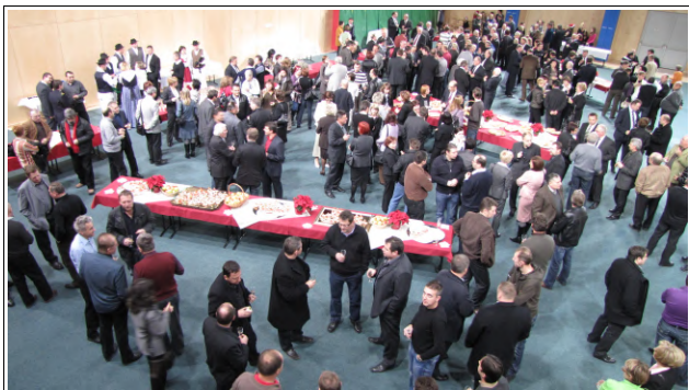
Sprejem