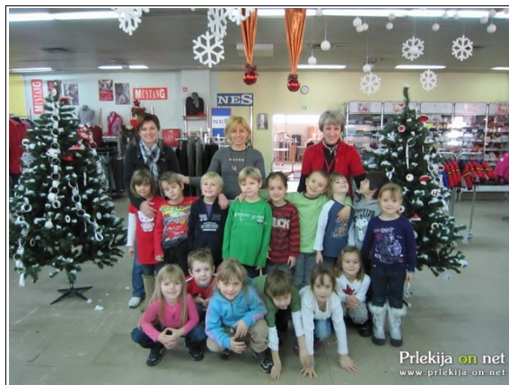
Vsi so bili zadovoljni

Ob koncu smo pripravili tudi kratek program in se predstavili s plesom in pesmijo. V podjetju so nas presenetili z darili, za katere se najlepše zahvaljujemo, obenem pa vas vse vabimo, da si vse skupaj ogledate tudi sami.