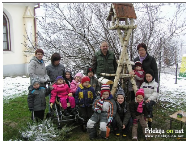
Otroci ob novi ptičji hišici

- S kladivom sem se vudra po prsti, pa me več nič ne boli.