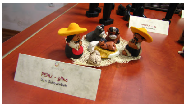
Jaslice iz Peruja

V Zavodu Marianum v Veržeju so od 10. decembra 2010 pa do 10. januarja 2011 na ogled jaslice. Na 3. Razstavi slovenskih jaslic in jaslic sveta si poleg nam običajnih slovenskih jaslic lahko ogledate okoli 60 jaslic iz celotnega sveta, ki so nam malo manj poznane in zato toliko bolj zanimive. Ogledate si lahko tudi številne jaslice, ki so jih