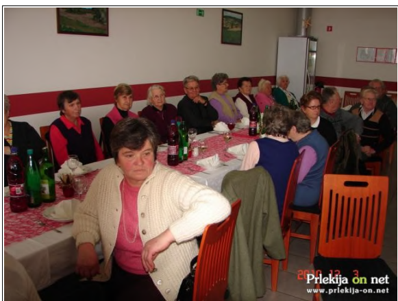
Srečanje starejših občanov Male Nedelje

RK Mala Nedelja v petek, 3. decembra pripravila tradicionalno srečanje krajanov, starih sedemdeset in več let. Kljub neugodnemu vremenu in slabi prevoznosti cest, se je v restavraciji hotela aMord zbralo precejšnje število vabljenih krajanov.