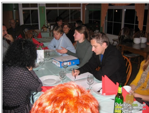
Vsestranski likovniki