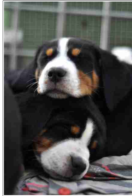
Veliki švicarski planšarski pes

privezan na verigi samo z namenom, da bi postal hud in vas varoval.