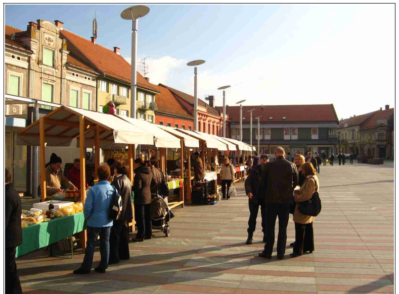
Tržnica na Glavnem trgu v Ljutomeru

Pri tržnici pa ne gre samo za nakupovanje ampak nenazadnje tudi za druženje, pogovor.