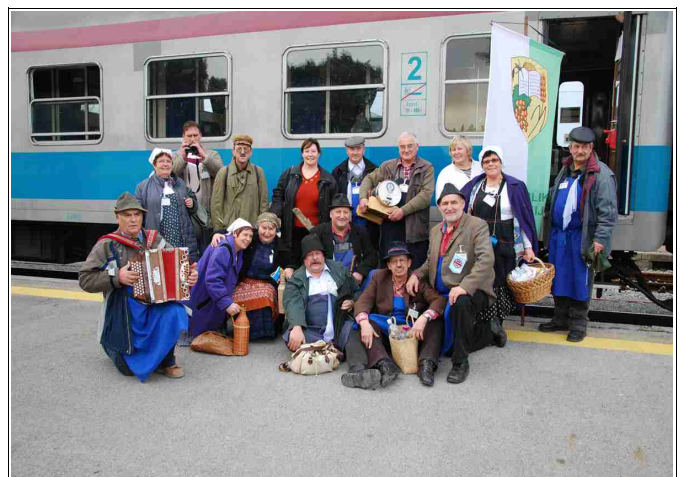
Künštini cug v Koper, december 2009

Leta bežijo, spomini pa bledijo. Med tem je bil še drugi in tretji cug. Prvi se ni ponovil, vsak pa je v nas zapisal le lepe spomine. V ljudeh je ostala vedno ključavajoča želja, spet potovati, doživeti nekaj več med svojimi Prleki.