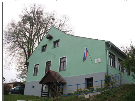
Vrtec Gresovščak, Foto: Matevž Kaučič

Dandanes se vrtec Gresovščak lahko pohvali, da je bil in še je prvi vrtec na vasi v Sloveniji. A laskavi naslov je kazila podoba stavbe, katero je načel zob časa in ni kazala igrivosti in življenja, katero se vsakodnevno nahaja v njej in sem jo občutil tudi sam, tako kot otrok, kot sedaj ko so me prijazno sprejele zaposlene vrtca s svojimi 16-imi varovanci. Razigrani, srečni in polni veselja, so mi vsi povprek razlagali, kaj vse počnejo v vrtcu, od obiskov starejših občanov, vaše čebelarke Mimike, do gasilcev prostovoljnega gasilskega društva Gresovščak, do raznoraznih sprehodov, katere jim omogoča narava ki jih obkroža.