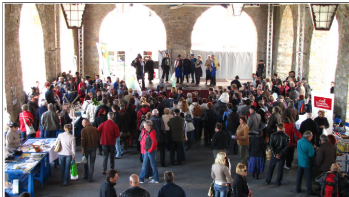
Prleki v Kopru, Foto: Dejan Razlag

Prve »Prleške cejtngje«, ki nosijo datum 26. marec in so bile namenjene tūdi potnikom na cugi, obiskovalcem Taverne in domačinom Kopra pa so dokaz, da je tūdi to velik prispevek k promociji.