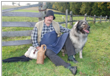
Pepkok pa Sultan, Foto: Nada Rožman

Zeja pa Sultan. Keri pa je te to? Sultan je, vite le, moj pes, ali lepše rečeno, moj nejbojši pedoš na toten sveti, pa veko pitaje je, či bon na »oven sveti«, dere bon se preselja to, nejša jemi rovnega. On je moj ejngel varuh in me noč pa den varüvle pred fsemi hudobnimi silami in mo več horbeti pa skrbi z menoj kak bilo keru.