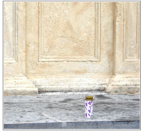
Sveča pri spomeniku, Foto: Komorov Mihalek

Pri sosednji mizi sedi mlajši par in se pogovarjata in zgražata nad tem dejanjem. Kot sem lahko slišal, govorila sta glasno (jeza), bi naj ravno pred kratkim popravili marmor na fontani in glej spet se uničuje. v nadaljevanju pogovora slišim, da so dnevi ko je nemogoče sedeti oz. prečkati trg saj so ti skejterji »okupirali« trg s hrupom in vratolomnimi vožnjami. Jezila pa sta se tudi, da nihče ne sme nič reči oz. opozoriti tem »mladim gospodom«, saj njihovo početje odobravajo.