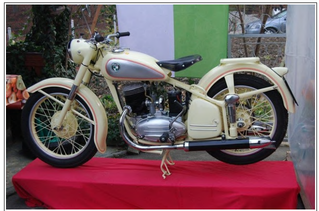
Prenovljen motor PUCH TF 250, Foto: Milan Belec

Obnova je trajala dobra štiri leta. Dne 17. oktobra 2009 smo bili zbrani, tisti kateri smo pomagali pri odkopu. Dvorišče Franca in Mimice je bilo slavnostno okrašeno. Pod šotorom pa pokrit motor. Radovedno smo pričakovali trenutek, ko bomo zagledali obnovljen motor. Zastava s katero je bil pokrit je bila odstranjena in v polnem sijaju se nam je razkril vrhunsko obnovljen motor. Originalna bež barva je kar zasijala, težko je bilo določiti kateri del je lepši. Sledil je zagon motorja, nekaj začetnih težav s prebijanjem elektrike je bilo hitro odpravljenih. Pritisk in zaslišal se je čudovit zvok kateri je naznanil, da je TF zaživel.