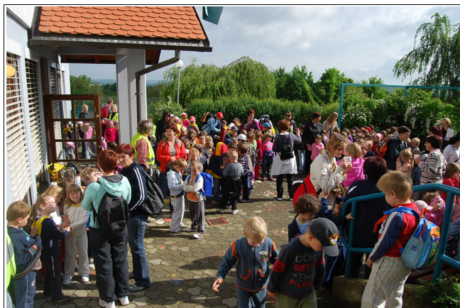
Vsi zbrani pred vrtcem

Letošnji 6. maj je bil za naš vrtec v Mali Nedelji poseben dan. Ta dan je v našem vrtcu potekala prireditev pod naslovom DAN PRIJATELJSTVA, in sicer že peta po vrsti. Ob 9. uri so se pred našim vrtcem zbrali otroci starejših skupin iz vrtcev Stročja vas, Cezanjevci, Stara Cesta, Ljutomer, Gresovščak, Cven ter iz sosednjih občin Rakrižje, Veržej in Križevci. Seveda so bili prisotni tudi otroci starejše skupine našega vrtca.