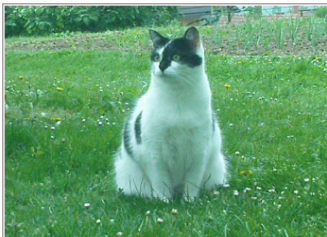
Mačka, Foto: Lilijana Grnjak

Brez hišnih ljubljencev bi naša življenja bila precej pusta, zato poskrbimo za njihovo zdravje in dobro počutje.