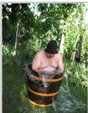
Pepek se kalūži

Eno por let se tota nevolja do rešiti na precik lehki, eleganten in enostaven način. Dere si nejpret pol vüre pred špeglon natezovlemo naše store kopalke na sebe, pret kak na kraji te le, celi rashicani in zadihani, preštímamo, ka smo krez zimo teko zrasli in se razlezili, ka naše riti več nemremo spraviti v lejsne kopalke, te se spakeramo in gremo lepo v štacün in si pač kúpimo kopalke kere mojo na tisten ceglci za velikost eden »X« več kak so jih mele lejsne.