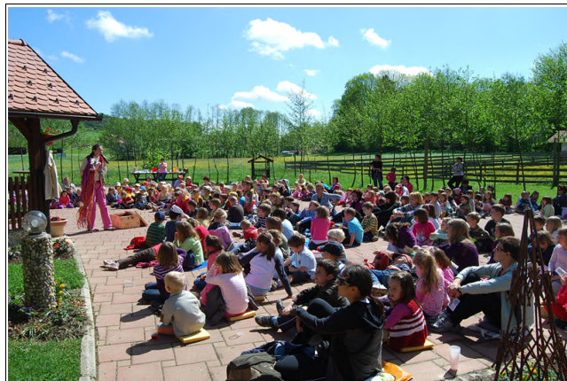
Pripovedovanje pravljice

doživetju. Kljub temu, da so se zjutraj po nebu podili sivi oblaki, nas je pozneje grelo toplo spomladansko sonce.