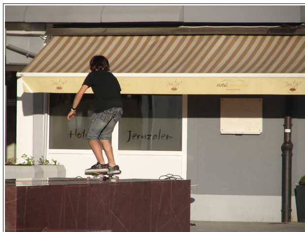
Rolkanje s fontane

Čez vikend sem spet prišel na obisk v Lotmerk in svojo žejo sem pogasil z vinom na eni izmed teras gostinskega lokala, na tržnici ga ni bilo.