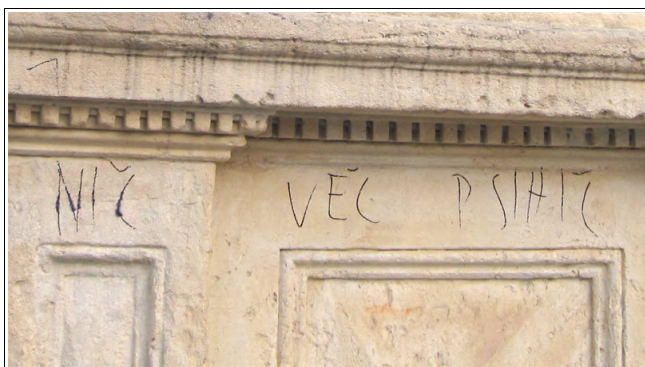
Napis na vznožju spomenika, Foto: Dejan Razlag

Že od same obnove trga je tako znamenje veliko bolj izpostavljeno raznim zunanjim vplivom, ljudje po njem celo plezajo, z rolkami uničujejo vznožje, prizori, ko je na in ob znamenju kup smeti so nekaj vsakdanjega, ne dolgo nazaj pa je celo nekdo vznožje znamenja popisal z velikim napisom "Nič več psihič". Napis verjetno opisuje željo po izboljšanju njegovega duševnega stanja, saj je tako ravnanje nedopustno.