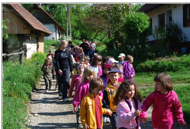
Otroci na pohodu

Po uvodnem pozdravu smo se odpravili na pohod, ki je potekal okrog 45 minut. Tako smo prijateljem razkazali ravnine in vzpetine ter lepote naše Male Nedelje.