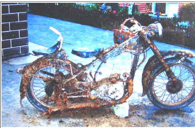
Izkopan motor PUCH TF 250