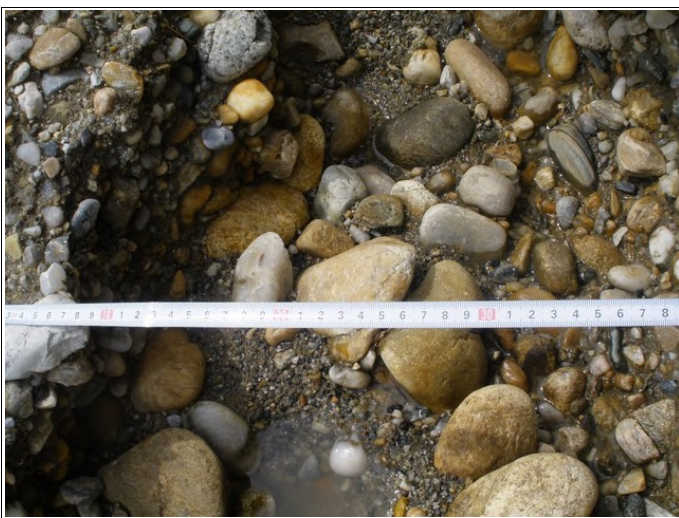
Jame na cesti

Kamenščak. Za gradnjo hiše sem si pridobil vsa potrebna gradbena dovoljenja s strani občine Ljutomer, seveda sem moral tudi poravnati komunalni prispevek - preden sem lahko začel graditi hišo.