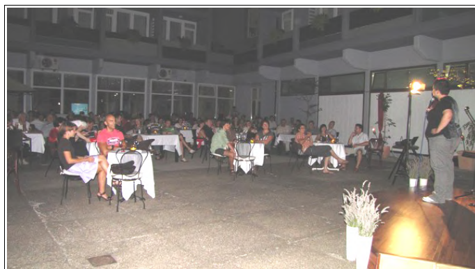
Terasa hotela Jeruzalem, Foto: Dejan Razlag

Do konca letošnjega leta se bo zvrstilo še pet stand up večerov.