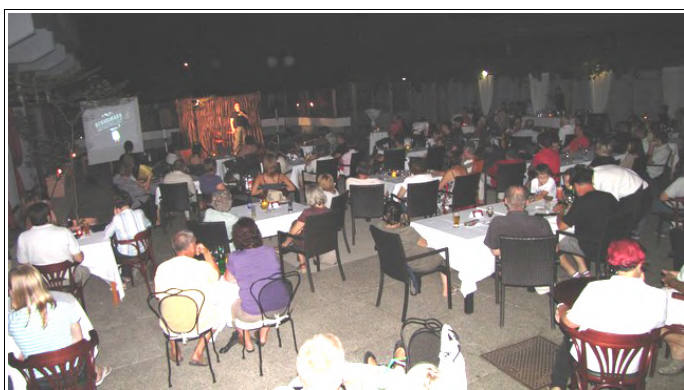
Terasa hotela Jeruzalem

Martina je dodobra nasmejala obiskovalce s humornim pogledom na različne teme in dokazala, da se resnično "ne šali, ko se šali".