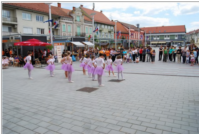
Nastop, Foto: GŠ Slavka Osterca

Skupaj z učitelji, ki so učencem podeljevali spričevala so se v prijetnem vzdušju vrstili nastopi posameznih učencev, predšolske glasbene vzgoje in glasbene pripravnice ter plesne pripravnice. Na trgu se je predstavil tudi harmonikarski in mladinski pihalni orkester. Številna publika, staršev, dedkov in babic je spremljala nastope in podelitve spričeval svojim otrok ali vnučkov.