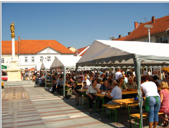
25. Prleški sejen po celen Lotmerki

Spoštovane Prlečke in Prleki, drage bralke in bralci Prleških cejtng, ponovno smo z vami, s peto izdajo našega in vašega tiskanega cejtnga.