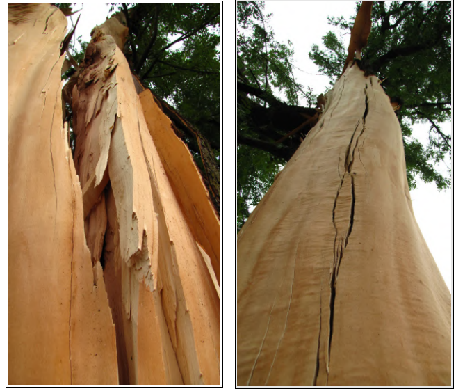
Razklano drevo

Strela je drevo razklala in "olupila", udarec pa je bil tako močan, da so deli drevesa ležali tudi 50 metrov od njega. Obseg drevesa je bil 160 cm.