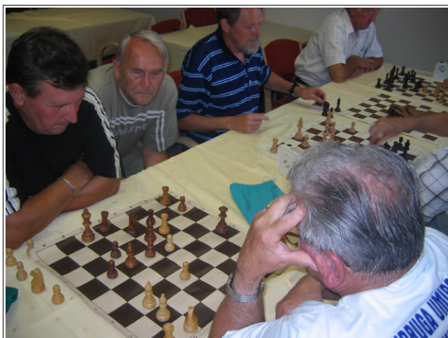
Šahisti