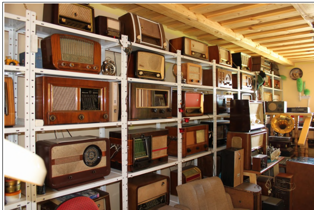
Zbirka radijev, Foto: Srečko Lukovnjak Kramberger

tudi v njem samem, saj se sam loti popravila, pri tem pa mu pomagajo prijatelji »radiotehniki«, kot se je nekoč reklo temu poklicu kot so; Tone Vozlič, Štampar, Pergar in drugi.