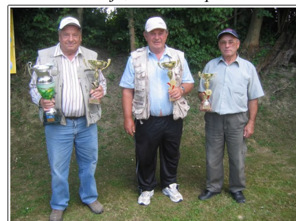
Zmagovalci, Foto: Filip Matko