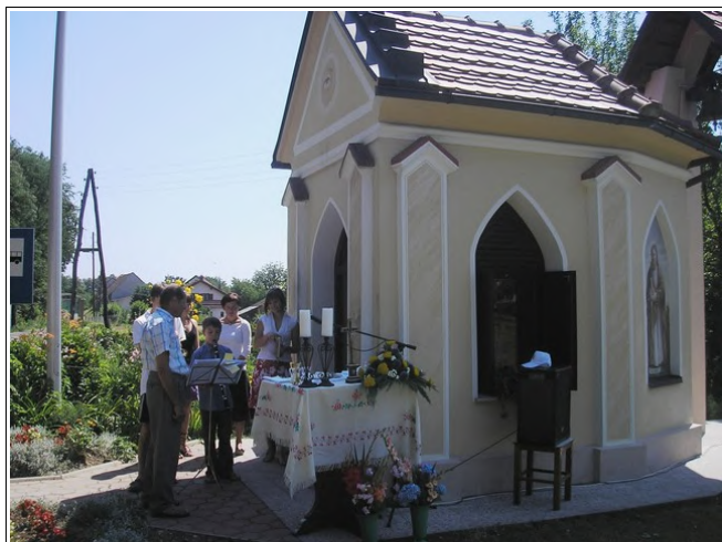
Fričova kapela, Več fotografij najdete na portalu Prlekija-on.net