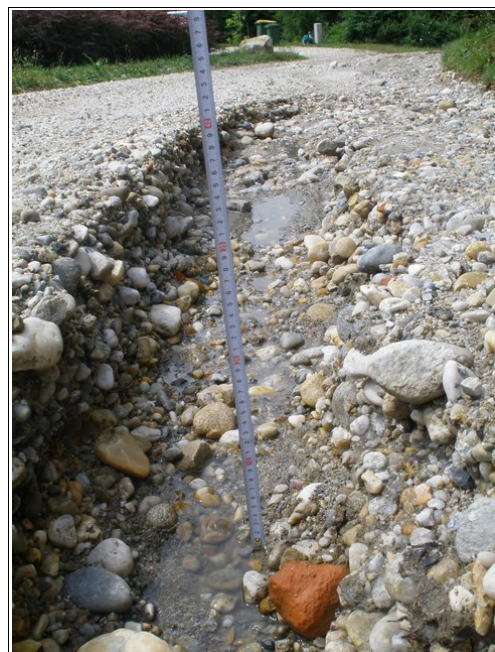
Jame na cesti

"Na Sp. Kamenščaku živim že kar nekaj let. Lani sem se tudi preselil v novo lastno stanovanjsko hišo v ulici oz. cesti, ki povezuje Radomerje in Sp.