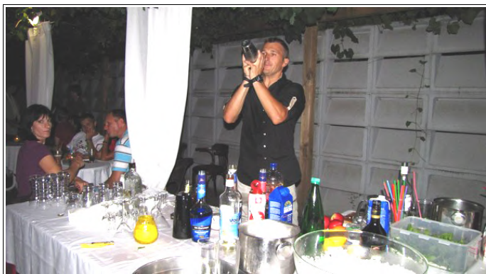
Cocktail Party

Večer je bil dopolnjen s "Cocktail partyjem", kjer je Seba pripravljaval odlične osvežilne koktejle. Kot pijačo dobrodošlice so obiskovalci lahko izbrali Renski Rizling KeSnI ali PriMuS (premierno) iz kleti VINOrejaKAUČIČ, ki je bila vključena v simbolično vstopnino 1 euro.