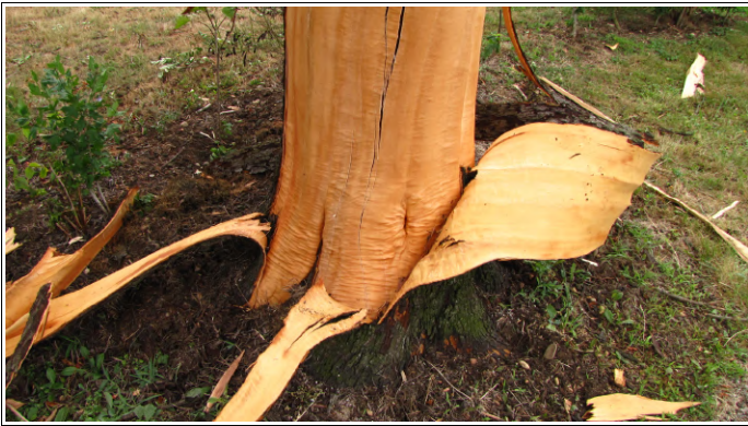
"Olupljeno" drevo

Hladna fronta z bliski in grmenjem, ki je sredi julija prešla Slovenijo, je malo ohladila ozračje, da smo po tednu z visokimi temperaturami lahko lažje zadihali. Manj sreče je ob tem imelo okoli 80-letno drevo skorš na ozemlju družine Stajnko iz Sp. Kamenščaka. Strela je udarila v drevo in jo razklala na pol, zato je bilo drevo potrebno podreti.