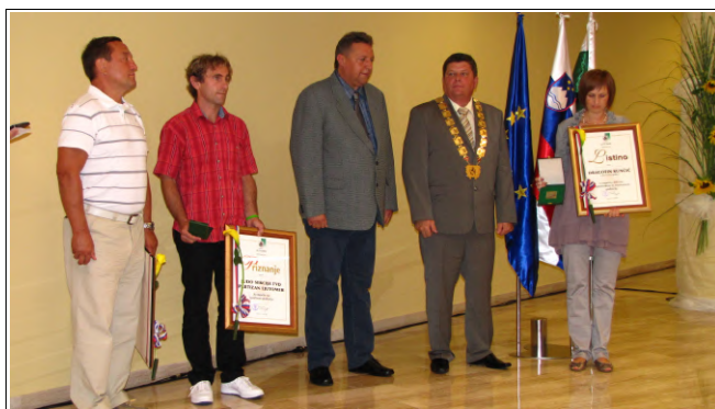
Dobitniki priznanj