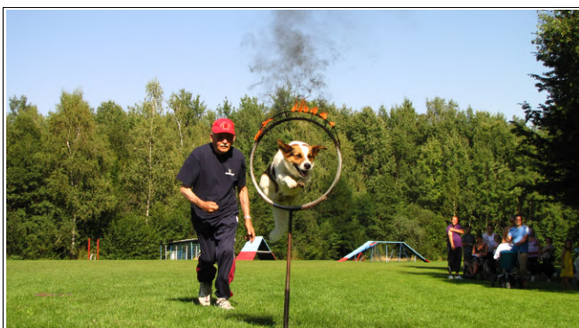
Skok skozi ognjeni obroč

V nedeljo, 22. avgusta, je Športno kinološko društvo Ljutomer-Križevci na vadbišču v Lukavcih ob svoji 25-letnici delovanja priredilo društveno tekmo in proslavo. Člani društva so se s svojimi štirinožnimi prijatelji predstavili na tekmovanju v poslušnosti, agilityju in teku psov na ukaz v različnih kategorijah ter gledalcem podrobneje predstavili in prikazali izvajanje le-teh.