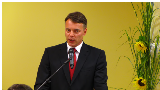
Henrik Gjerkeš

V soboto, 7. avgusta, je v konferenčni dvorani Hotela Bioterme v Moravcih v Slovenskih goricah potekala slavnostna prireditev s podelitvijo nagrade in priznanj Občine Ljutomer za leto 2010. Slavnostni gost je bil minister Službe Vlade Republike Slovenije za lokalno samoupravo in regionalni razvoj dr. Henrik Gjerkeš.