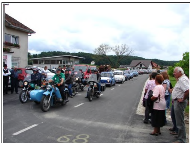
Prva vožnja po obnovljeni cesti

Kulturni program so izvedli Godba na pihala, folklorna skupina in ljudski pevci KD Anton Krempel od Male Nedelje, učenci OŠ Mala Nedelja in člani družine Stajnko iz Vidanovec.