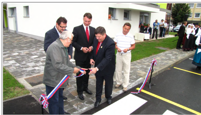
Slavnostni prerez traku

Po otvoritvi so si obiskovalci lahko tudi ogledali stanovanja v objektu, ki ima 20 stanovanj ter je bil zgrajen na podlagi javno-zasebnega partnerstva med občino Ljutomer in družbo PGP Ljutomer, vrednost objekta pa znaša 1,5 milijona evrov. Pet stanovanj je v lasti občine Ljutomer, devet še jih je naprodaj. V okolici objekta je bila urejena tudi komunalna infrastruktura, 62 parkirišč in dovozna cesta.