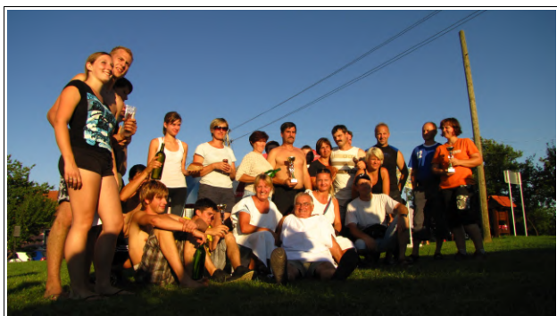
Ekipe rimskih iger

V nedeljo, 1. avgusta, so na Stari Cesti potekale že IX. sodobne rimske igre, ki jih organizira Turistično društvo Stara Cesta. V igrah, ki so potekale pri gasilskem domu je nastopilo pet ekip: Prleki, Patrioti, Power, Špricarji in ekipa Desnjak. Zmagala je ekipa iz Desnjaka.