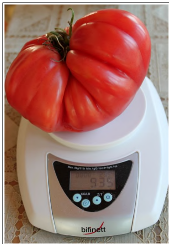
Paradižnik 935 gramov

Od izdaje zadnje številke cejtng smo dobili več namigov bralcev, da bi v vsakem izvodu zaradi zanimivega branja in dogajanja predstavili vsaj dva in več rekordov. Z vašo pomočjo dragi bralci dobivamo klice in namige kje se skrivajo "presežki" naših Prlekov. Vabimo vas, da nam sporočite nenavadne dogodke in vas bomo obiskali.