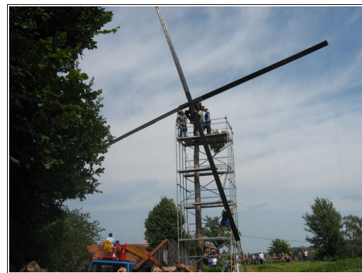
Največji klopotec na svetu, Foto: Marija Krajnc

Dogodek si je ogledalo veliko radovednih ljudi, ki so prišli tudi z drugih koncev Slovenije in tako prisostvovali postavitvi klopotca velikana.