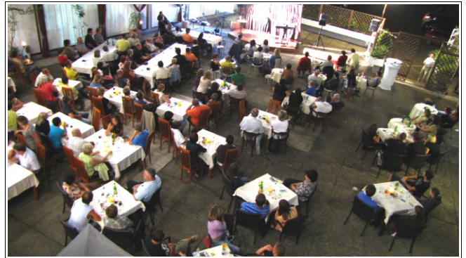
Terasa hotela Jeruzalem

VINOrejaKAUČIČ, ki je bila vključena v vstopnino.