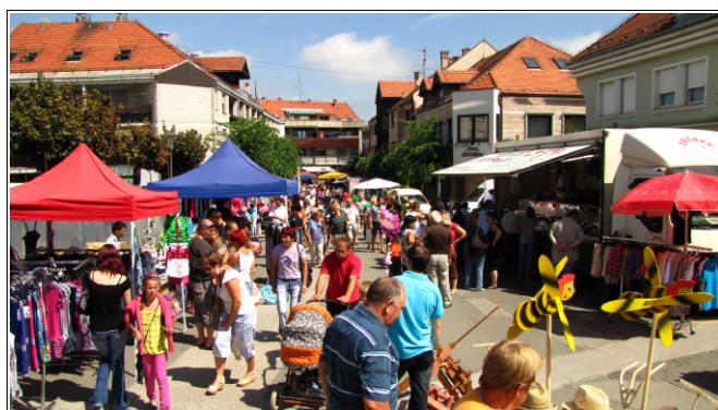
Prleški sejen

Na sejmu smo svojo stojnico imeli tudi Prlekija-on.net/Prleške cejtng, kjer ste obiskovalci lahko dobili izvod vseh števil Prleških cejtng, izpolnili naročilnico, dobili kakšno nalepko ali balon ter fotografijo iz sejma, ki smo jih izdelovali kar na stojnici. Na sejmu smo podelili preko 500 števil izvodov, vsi ki ste se na cejtng tudi naročili pa, kot obljubljen, samodejno sodelujete v tokratni nagradni igri.