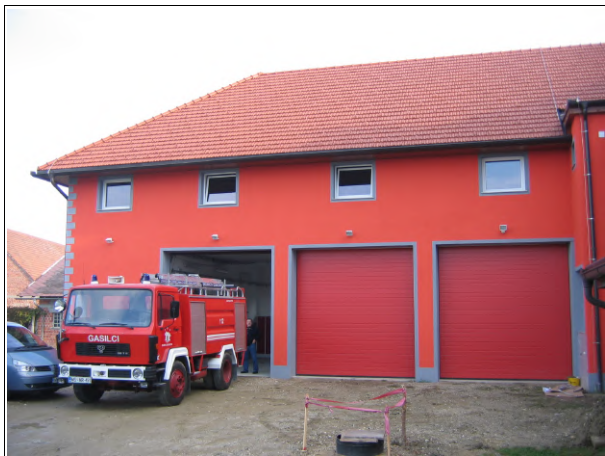
Dan odprtih vrat PGD Radenci-Boračeva

V mesecu požarne varnosti so v soboto, 23. oktobra, med 9. in 17. uro pripravili dan odprtih vrat obnovljenega gasilskega doma v Radencih, ki ga ima na skrbi Prostovoljno gasilsko društvo Radenci-Boračeva.