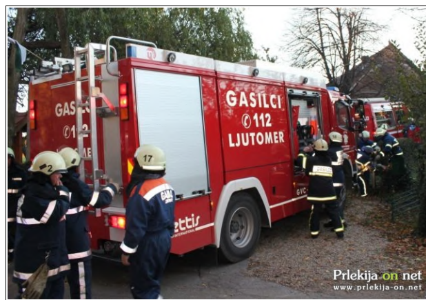
Gasilci Ljutomer

pod strokovnim nadzorstvom praktično prikazana uporaba priročnih gasilnih aparatov za zaposlene v Mladinskem centru.