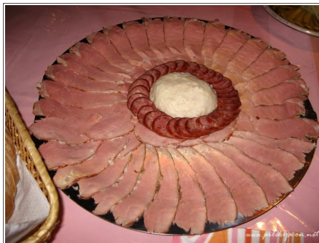
Meso s tünke

za te tri označbe preučiti v roku enega leta od njihovega prejema. Če je vloga popolna, Evropska komisija v Uradnem listu EU-ja objavi povzete vloge, nato pa lahko v roku šestih mesecev od objave države članice ali tretje države podajo ugovore na objavljene vloge. Če ugovorov ni, komisija proizvod registrira.