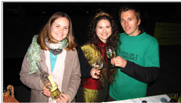
Na zdravje