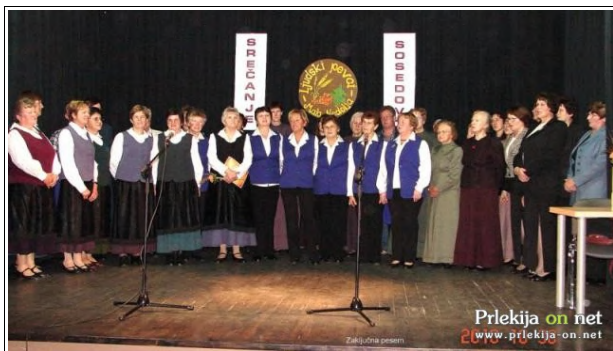
17. Srečanje sosedov