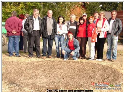
TKD Babinci pred posejano parcelo