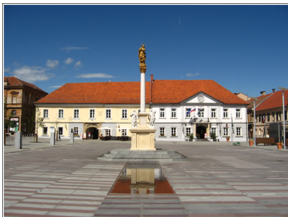
Glavni trg v Ljutomeru

Projekt Moja dežela – lepa in gostoljubna je potekalo pod častnim pokroviteljstvom predsednika republike dr. Danila Türka. Mestno jedro Ljutomera je tako zasedlo prvo mesto v kategoriji mestnih jeder, ki ga je ocenjevala tričlanska strokovna komisija in sicer arhitekt, krajinar in zgodovinar.