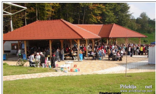
Prireditveni prostor, Foto: Branko Košti

Sredi neokrnjene narave termalnega parka Bioterme Mala Nedelja se je v soboto, 9. oktobra, zbralo okrog 500 naročnikov Nedeljskega dnevnika in njihovih družinskih članov iz vse Slovenije na tradicionalnem družinskem pikniku.