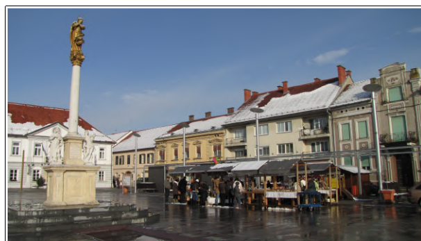
Božični bazar, Foto: Dejan Razlag

Učenci osnovnih šol so svoje izdelke ponesli na ogled tudi po okoliških blokih in domovih.