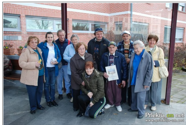
Ekipa DOSOR-ja, Foto: Filip Matko