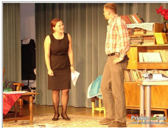
Gledališčniki od Male Nedelje v Ponikvi pri Žalcu

brezposelnim delavcem Vegrada, drugo polovico pa bodo namenili pomoči potrebnim v domači župniji.