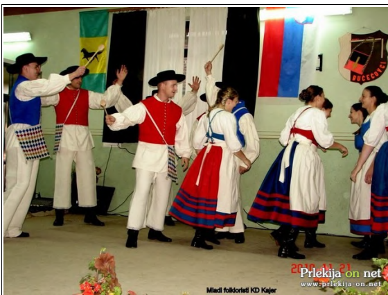
Mladi folkloristi KD Kajer

Prizadevni člani KD Kajer iz Bučečovec so pripravili že drugo odmevno prireditev v letošnjem letu. Junija so izvedli prireditev z naslovom S kajera vün potegjeno, na kateri so predstavili nove folklorne kostime in knjigo Oblačilna in plesna dediščina Murskega polja. V nedeljo, 21. novembra popoldne, so v dvorani vaško gasilskega doma izvedli že deveto prireditev pod naslovom Drogi sosid dober den.