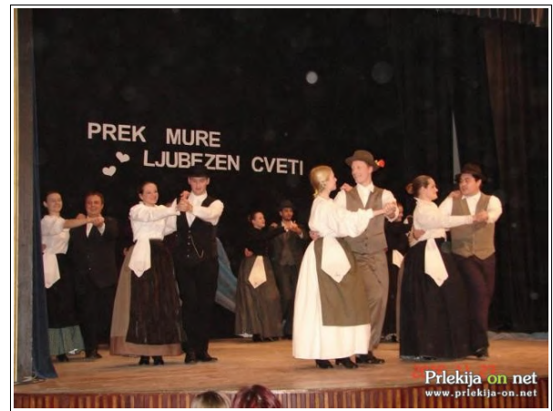
Prek Mure ljubezen cveti

Petovarja in navdušen aplavz publike ob koncu prireditve nedvomno pomeni priznanje za dosedanje uspehe FS Leščeček in močno vzpodbudo za nadaljnje delo.