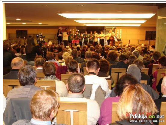
Škofijski klic dobrote pri Mali Nedelji, Foto: Branko Košti

starša sta nezaposlena, očeta pri delu ovira tudi bolezen. Skrbita za šest otrok, štirje obiskujejo še osnovno šolo, dva pa srednjo. Z zbranimi sreditvi želijo urediti bivalne prostore v novozgrajeni hiši.