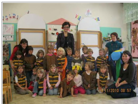
Županja na medenem zajtrku v Vrtcu Ljutomer