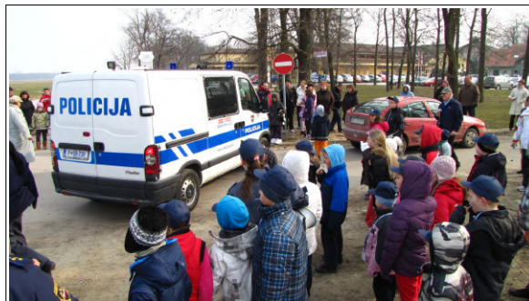
Otroci in policija, Foto: Dejan Razlag

Sledil je preventivni del projekta, ko so si lahko udeleženci ogledali policijsko opremo, ki jo policisti uporabljajo pri opravljanju vsakodnevnih nalog, ter se s sodelujočimi policisti pogovorili in si izmenjali svoje izkušnje. Otroci so lahko videli tudi opremo, ki jo uporabljajo specialne enote policije, termo kamero, nočni daljnogled in se sprehodili s posebnimi očali, s katerimi vidijo svet podobno, kot tisti, ki so pod vplivom alkohola ali nedovoljenih drog. Ogledali so si tudi t.i. "Schengen bus", ki ga uporabljajo pri varovanju Schengenske meje ter vozilo z video nadzorom "Provida", za nadzor in urejanje cestnega prometa. V Banovce je prišla tudi policijska konjenica iz Maribora, ki skrbi za red v severovzhodni Sloveniji.