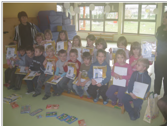
Otroci Vrtca Stročja vas