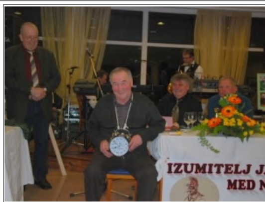
Občni zbor

Več fotografij najdete na portalu Prlekija-on.net