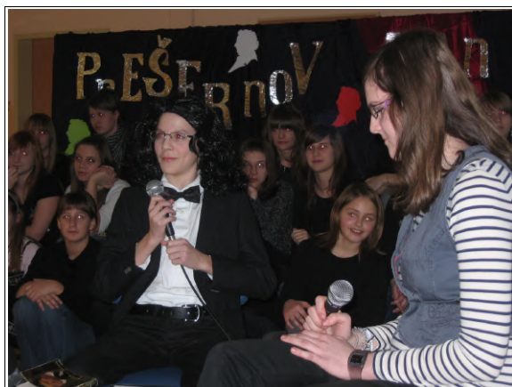
Pogovor s »Prešernom«

Fotografije najdete na portalu Prlekija-on.net