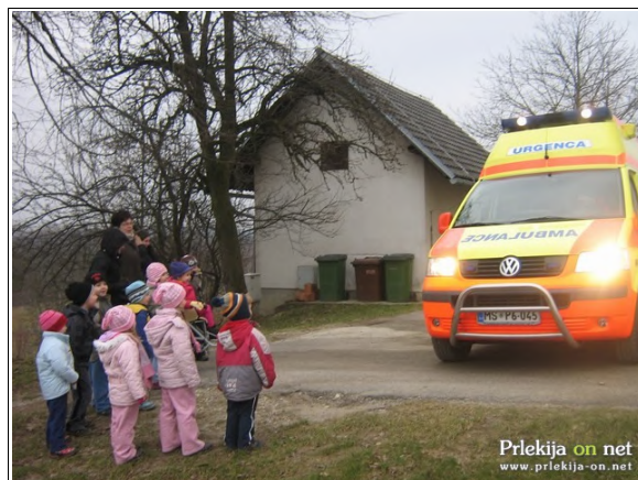
Otroci ob reševalnem vozilu

Po odhodu reševalca so otroci z navdušenjem narisali