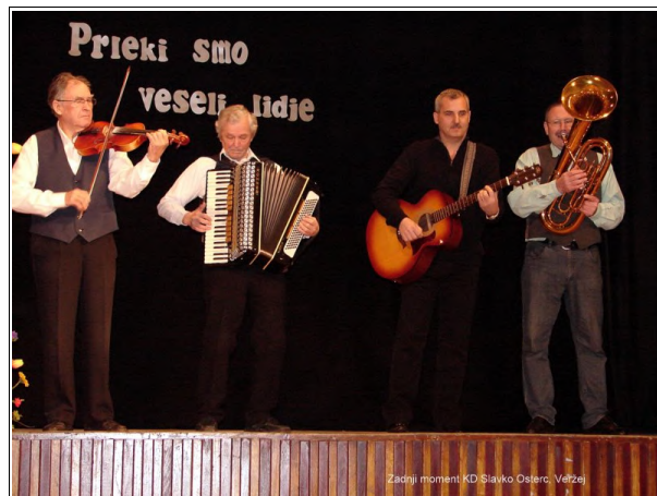
Zadnji moment KD Slavko Osterc Veržej

spremljevalec, predstavljali naše območje na regijskem srečanju.