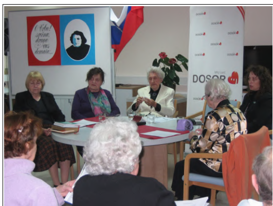
Praznično v knjižnici