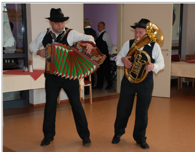
Muzikanta, Foto: Petra Gašpar

priljubljene melodije, kjer so lahko s svojimi glasovi še sami pritegnili znanim slovenskim ljudskim pesmicam.