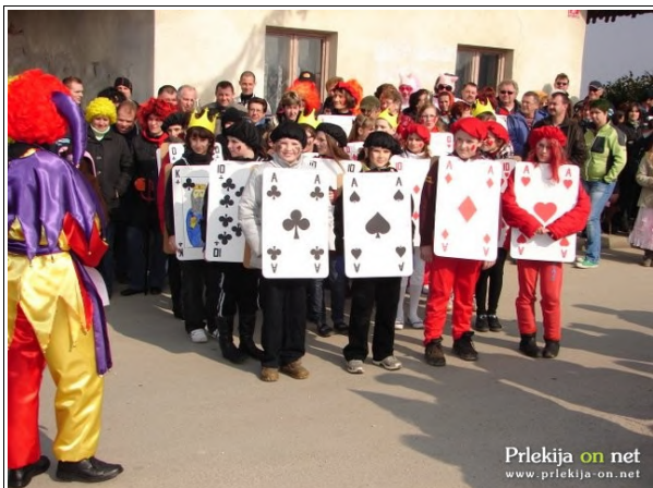
Povorka pri Sv. Tomažu

Sekcija Koranti, ki deluje v okviru TD Sv. Tomaž, je tudi na letošnjo pustno soboto pripravila tradicionalno pustno povorko. Za Pihalno godbo iz Dornave so se v povorki predstavili otroci vseh skupin domačega vrtca Ježek, učenci vseh razredov osnovne šole Sv. Tomaž, nato pa še skupine iz okoliških vasi in TD Mala Nedelja - Radoslavci.