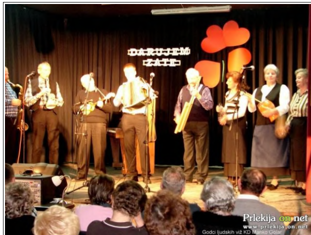
Godci ljudskih viž KD Manko Golar

zahvalil predsednik KD Branko Košti in jih seznanil, da je bilo z vstopnino in prostovoljnimi prispevki zbranih 1.713,00 evrov. Sredstva so bila nakazana na račun, odprt za Cvetko pri RK G. Radgona.