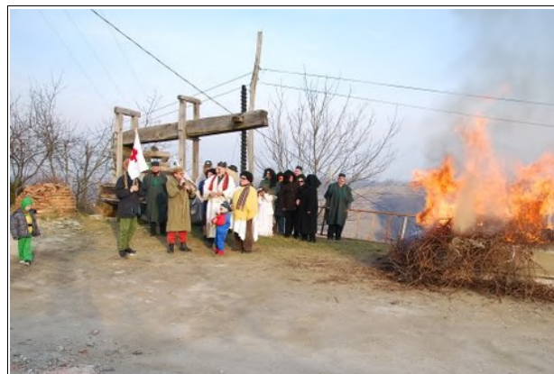
Faşenk je zgorel

Pridružila se mu je tudi Hrvaška predsednica vlade ga. Jadranka Kosor, katera si ravno tako želi priti v naše kraje takoj ko bo končala na Hvaškem.