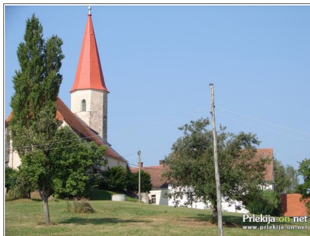
Mala Nedelja