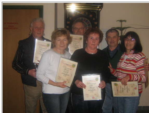
Društveni prvaki pikada 2011, Foto: Filip Matko

Karas (697) in 5. Janez Koren (660). Najboljši trije v obeh konkurencah so prejeli pisna društvena priznanja in praktična darila donatorjev, kar bo ponovljeno tudi na ostalih društvenih tekmovanjih. Že 4. aprila se bodo v okrepčevalnici Simona zbrali tekmovalci za kartanje.