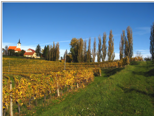
Jeruzalem, Foto: Dejan Razlag

Ilse Fischerauer vrtna arhitektka, katera je načrtovala vrt na Jeruzalemu oziroma je njena ustvarjalnost segala tako daleč, da je pustila s svojim bivanjem na Jeruzalemu temu kraju nesluten pečat.