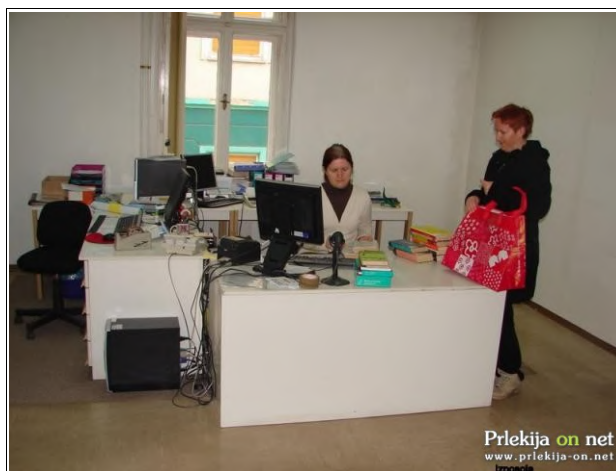
Začasna izposojevalnica

Največji pridobitvi te preureditve bosta domoznanska zbirka v enem prostoru, saj je bila doslej ta zbirka locirana na treh lokacijah, nekaj eksponatov je bilo tudi uskladiščenih in nova, večja in svetlejša čitalnica, ki jo bo mogoče na hitro preurediti v prireditveni prostor za predstavitve, pravljíčne urice, predavanja ipd. Pri teh izvedenih delih so bili skrajno gospodarni, veliko večino del so opravili sami, sami so preplekali tudi prostore.