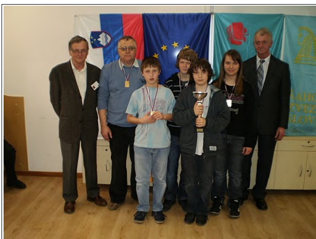
Ekipe skupaj s sodnikoma tekmovanja in spremljevalcem

Zmage so dosegli proti ekipam iz OŠ Ig, Nove Jarše, Šmarje pri Jelšah, Stražišče in Otočec z rezultatom 3:1, proti ekipi OŠ Gorišnica so zmagali 4:0, proti ekipi OŠ Šempeter pri Novi Gorici in OŠ Elivire Vatovec iz Kopra pa so zmagali z rezultatom 2,5:1,5.