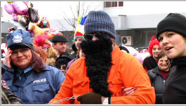
Zapornik iz Gvantanamo, Foto: Dejan Razlag

V nedeljo, 6. marca, je v Ljutomeru na Glavnem trgu potekal Fašenk v Lotmerki 2011, ki ga tradicionalno vsako leto prireja Turistično društvo Ljutomer. Na prireditvi so najprej