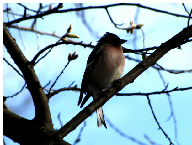
Ščinkavec