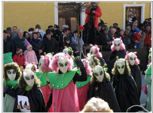
Marsovci, Foto: TIC Ormož

Po povorki je sledila razglasitev nagrad v fašenskem šotoru za Hotelom Ormož, kjer je za dobro vzdušje poskrbela skupina Langa.