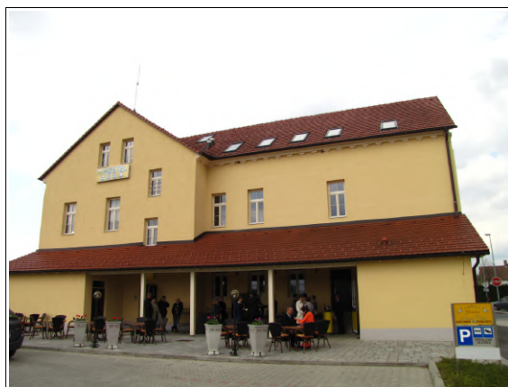
Eko hostel, Foto: Dejan Razlag

toplote. Zaradi teh rešitev je ogrevanje stavbe zelo učinkovito z vidika porabe energije in minimalnih vplivov na okolje. V poletnih mesecih pa se celotna stavba hladi z uporabo kombinacije hlajenja in stalnega centralnega prezračevanja z izkoriščanjem naravnega hlada podtalnice.