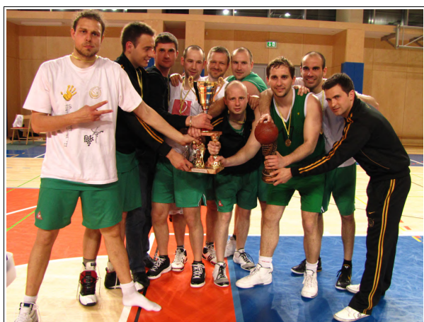
PŠK Ljutomer 1

V prvi tekmi najboljše četverice, med ekipama KD Sobota in PŠK Ljutomer 2, so slavili KD Sobota, v drugi tekmi med PŠK Ljutomer 1 in KK Paloma Sladki Vrh pa PŠK Ljutomer 1.