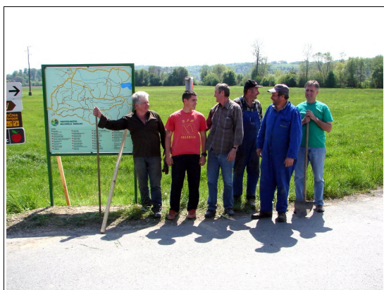
Ob tabli

Turistično društvo Mala Nedelja-Radoslavci in čedalje številnejši ponudniki gostinskih, prenočitvenih in drugih dejavnosti, želijo svojo ponudbo približati gostom, ki v naš kraj prihajajo predvsem zaradi Bioterm. Večini turistov namreč ne zadostuje samo ponudba kopaljšča, ampak želijo spoznati bližnjo in daljno okolico, kontaktirati z domačini, si ogledati naravno in kulturno dediščino, okusiti kulinarne dobrote in obiskati vinske kleti, zajahati konje ali se popeljati s kočijo.