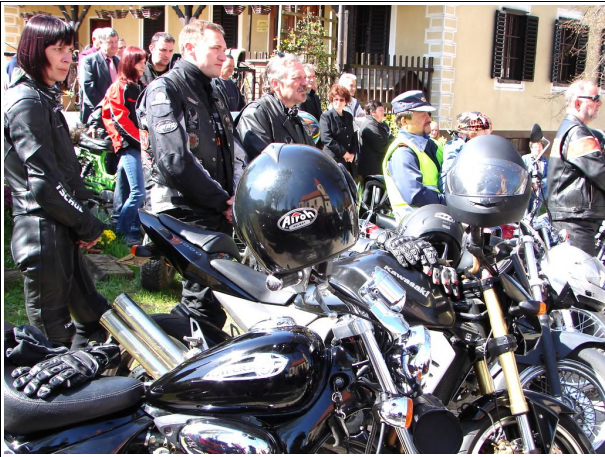
Motoristi