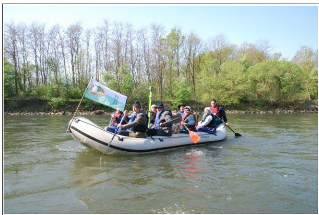
Künštni Prleki na reki Muri

17. aprila smo se Künštni Prleki spustili s čolni po reki Muri. Pot smo pričeli blizu Konjišča v občini Apače, končali pa v Ižakovcih, kjer smo se sporekli o meji Republike Prlekije in Prekmurja. Pot je bila zelo čudovita, saj smo se veselili z glasbo in petjem. Med samo plovbo smo ugotovili, da naj narava poskrbi za mejo med Republiko Prlekijo in Prekmurjem, saj je prvič v zgodovini po reki Muri plula zastava Republike Prlekije, katera je označevala mejo med Prleki in Prekmurci.