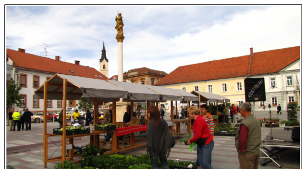
Lotmerk v cvetoči pomladi 2010, Foto: Dejan Razlag

Vabijo vas Občina Ljutomer, LTO Prlekija Ljutomer, JSKD - Območna izpostava Ljutomer, Prlekija-on.net, Hotel Jeruzalem, Vinoreja Kaučič, Mediaart in Klub prleških babic.