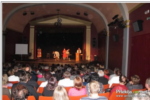
Glasbeno-gledališki performans

Obiskovalci predstave so bili sprva nekoliko zadržani, a so kaj hitro spustili zavore in smeh je kmalu preplaval dvorano. Tako sta dogajanje na odru spremljala smeh in aplavz. 80-minutna predstava, ki je v slovenščini ohranila ime Monty