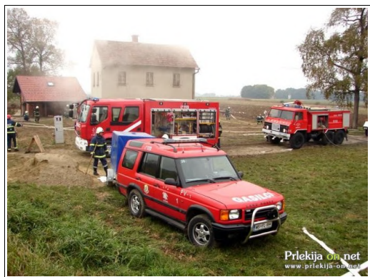
Gasilska vaja

Letošnji oktober, mesec varstva pred požari, je potekal ob sloganu "Ste storili vse za varen dom?" Namen projekta je opozoriti, da doma in v neposredni okolici obstaja veliko nevarnosti, ki lahko povzročijo požar.