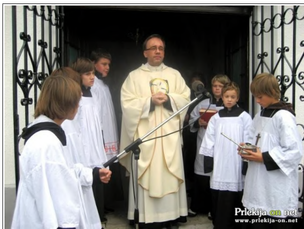
Blagoslov kapele pri Mali Nedelji

Praznik Vseh svetih je bil na pokopališču pri Mali Nedelji letos malo drugačen kot sicer, saj so številni obiskovalci grobov svojih najdražjih prisostvovali tudi blagoslovitvi prenovljene kapele na tem pokopališču, ki jo je opravil župnik Tomislav Roškarič.