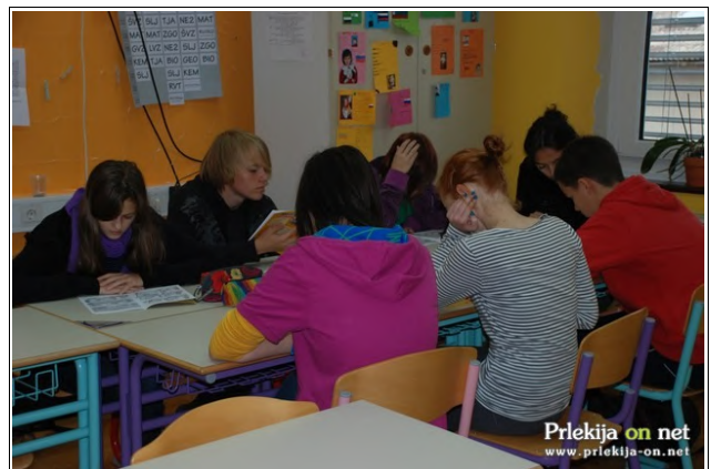
Osveščanje mladih na Osnovni šoli Radenci