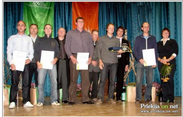
Vsi nagrajenci