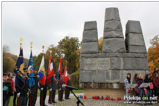
Osrednja slovesnost v Ljutomeru

nemškimi okupatorji. Po njem se od leta 1977 poimenuje tudi šola v Cezanjevcih.