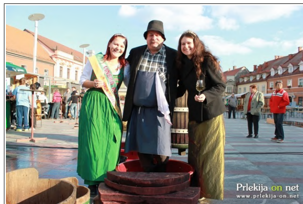
Pepek in kraljici

brega. Za glasbeni program sta skrbela DJ Davorinn in s svojim solidnim nastopom prleški pevec Simon Cokan.