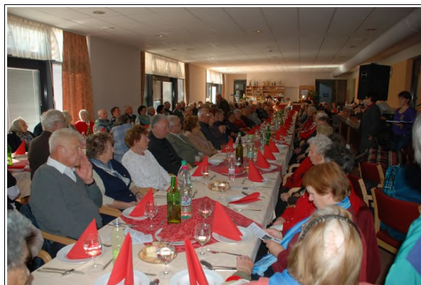
Srečanje starejših občanov

zagotavljajo prijazno življenje. Zatorej je v takšni družbi vedno lepo, kot tudi ob druženju s sproščenim klepetom in morda še kakšno pesmijo in plesom. Za slednje je namreč na tokratnem srečanju poskrbel »one man band« Štefan Sečko z Vaneče.