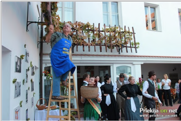
Svečana trgatev

Martina - klub vinskih kraljic Ljutomera, je v petek, 30. septembra, pripravil prireditev Prleška brotva, kjer so opravili svečano trgatev mestnega trsa.