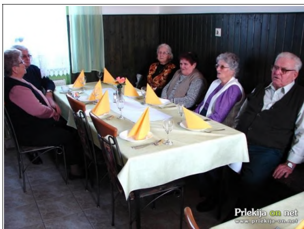
Srečanje starejših krajanov KS Mala Nedelja